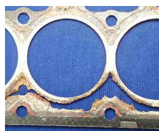
未使用Glysantin的汽缸顶部垫圈