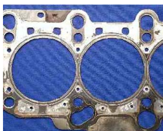
使用Glysantin的汽缸顶部垫圈