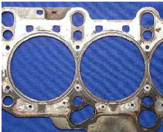
使用Glysantin的汽缸顶部垫圈