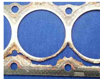
未使用Glysantin的汽缸顶部垫圈